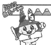
〈喜茂別町〉 ウサパラくん