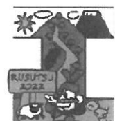
〈留寿都村〉 るすっぴー

羊蹄山ろく6町村のご当地ピンバッジを並べると『YOUTEI (ようてい)』の文字になります。かわいいご当地キャラクターを集めてみませんか?(各 500円) お求めは各地域の社会福祉協議会へどうぞ。