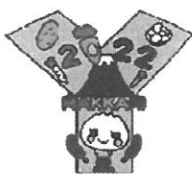
〈真狩村〉 ゆり姉さん