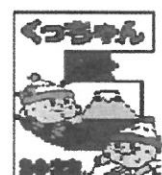
〈倶知安町〉 じゃが太くん じゃが子ちゃん