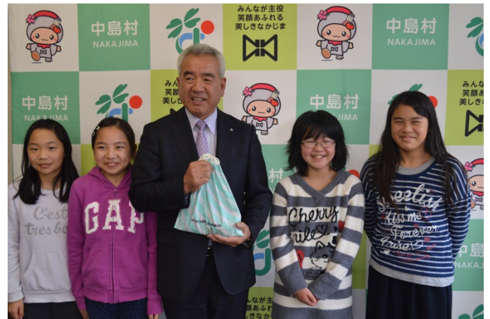
滑津小学校企画委員会の代表

保育所や幼稚園、各学校から毎年募金が寄せられており、今年も各代表の子供たちが募金をもってきてくれました。