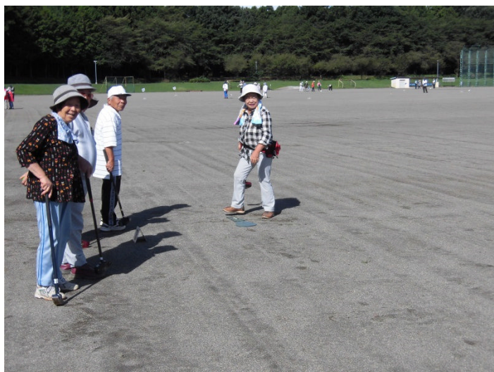
老人クラブ連合会長杯グラウンドゴルフ