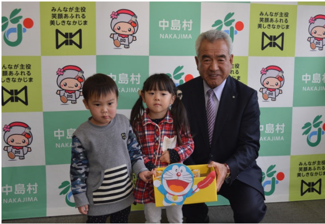
保育所代表のお二人