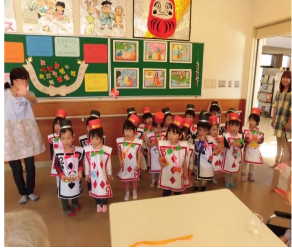
保育所の子供たちからのプレゼント