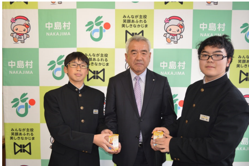
中島中学校生代表