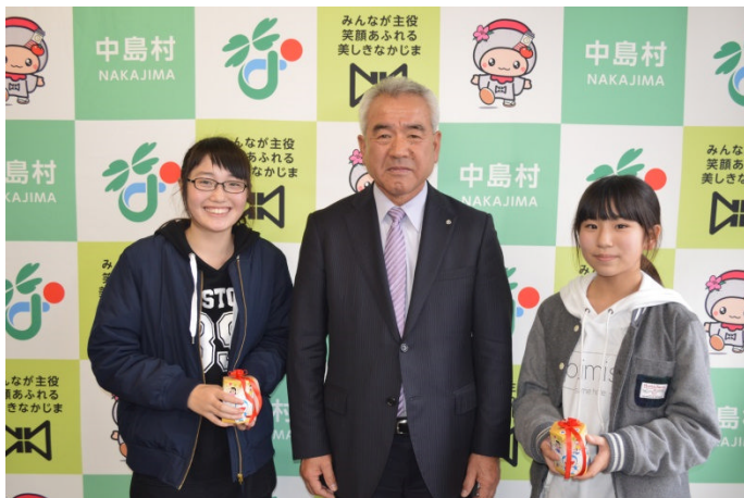
吉子川小学校 JRC 委員会の代表