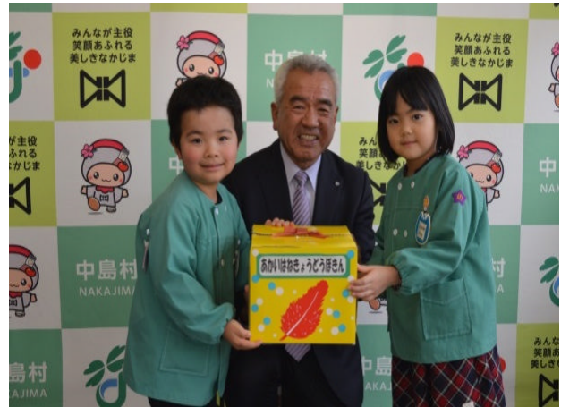
幼稚園代表のお二人