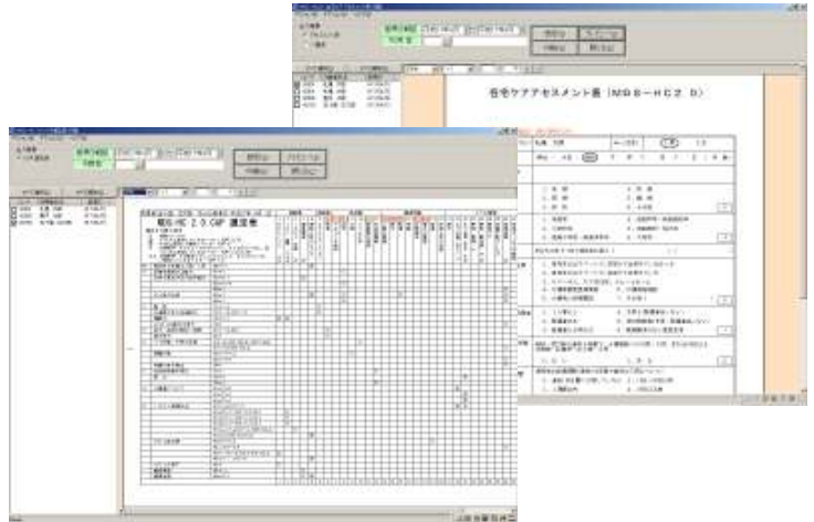
【在宅ケアアセスメント表・CAP選定表】