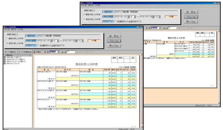
【売上分析表印刷画面】

受注伝票を入力すると、自動的に「作業日」ごとに集計され、作業指示書が印刷可能です。請求データには反映されない「試供品」「店舗販売分」も対象となります。