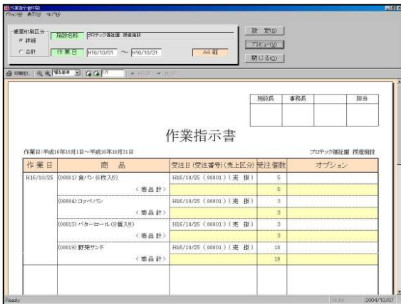
【作業指示書印刷画面】

印刷する請求書は「領収書付きタイプ」「売上明細付きタイプ」等、豊富にご用意しています。