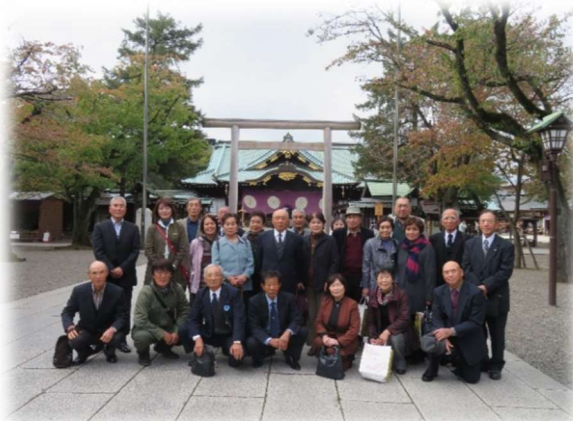
西白河郡遺族連合会研修旅行（靖国神社参拝）