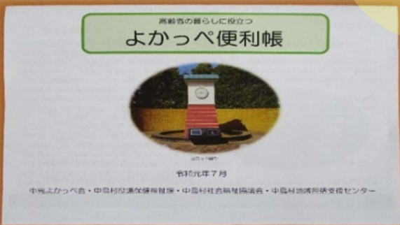
高齢者の暮らしに役立つ 『よかっぺ便利帳』を作成しました