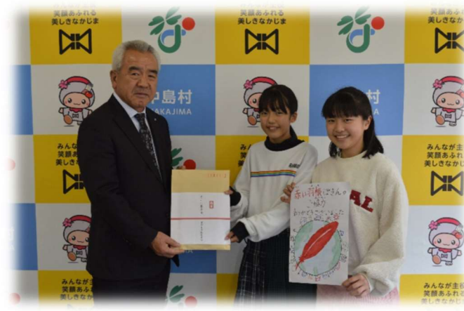
滑津小学校児童会