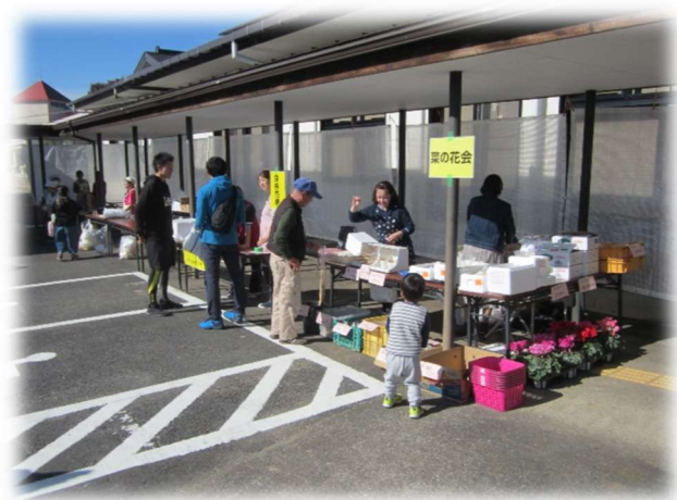
菜の花会の野菜販売