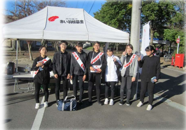
赤い羽根街頭募金