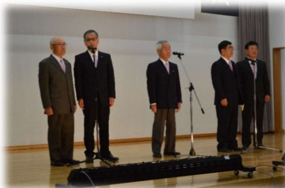
西白河郡老人クラブ芸能発表会（吟詠会）