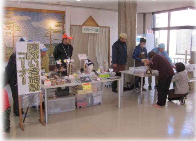
障がい者施設作品販売