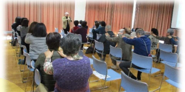
支えあいの地域づくり講演会 の企画・開催