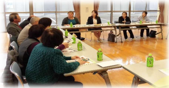
外部講師を招いての 地域づくりの勉強会