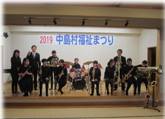
中島中学校吹奏楽部の演奏

中島中学校吹奏楽部の演奏やボランティア団体による日本舞踊、フラダンス、よさこい、太極拳などのステージ、菜の花会による野菜の販売、障がい者施設の作品販売、日赤奉仕団、職員による模擬店、福祉車両の展示、赤い羽根街頭募金等を実施。