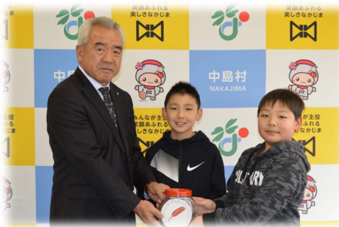
吉子川小学校 JRC 委員会