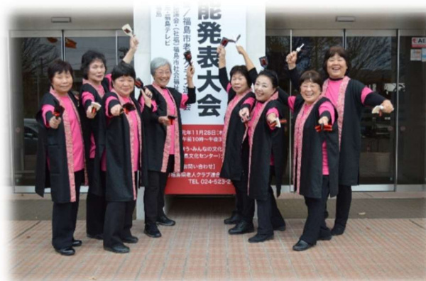
福島県高齢者芸能発表大会（KKKB67）