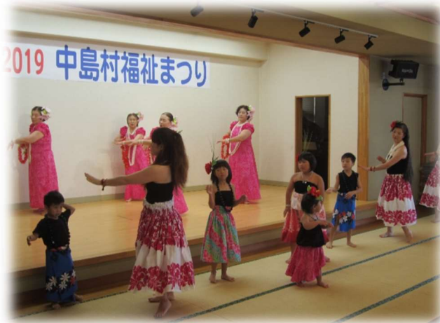
ボランティア団体のステージ