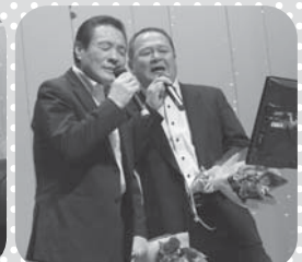
礼文町建設協会様