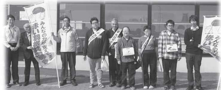
礼文町うすゆきの会