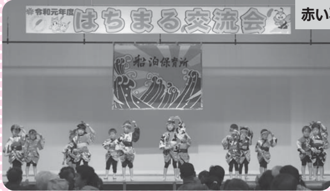
船泊保育所：南中ソーランファッションズver.