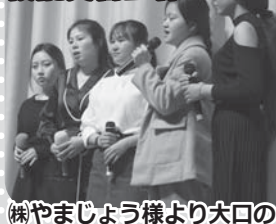
(株)やまじょう様より大口の義援金をいただきました。