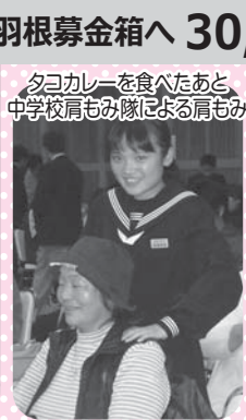
夕ヨカレーを食べたあと、中学校肩もみ隊による肩もみ