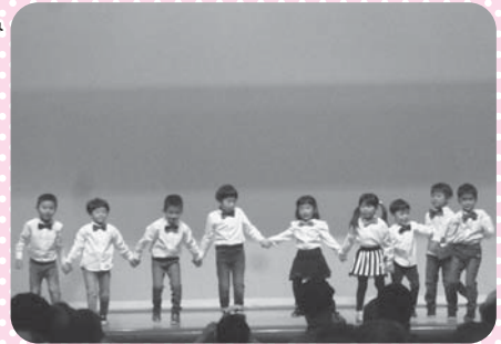
はちまる歌劇団によるジェシカ