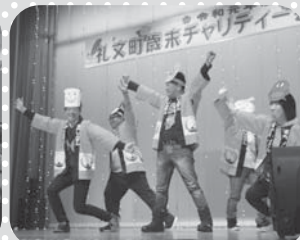
稚内信金礼文支店様