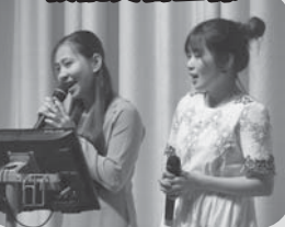
香深漁業協同組合 技能実習生様